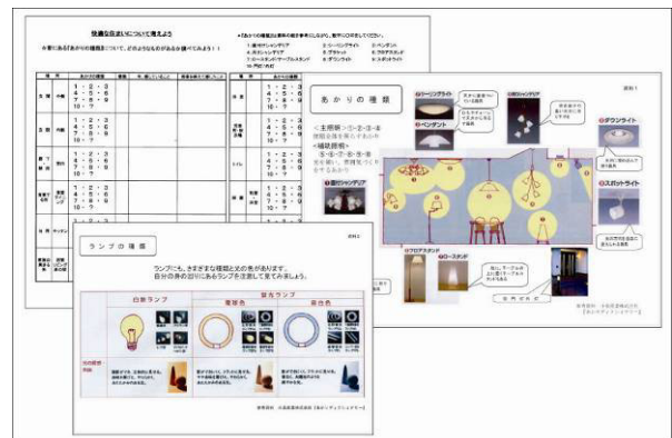
図2-1 「私のすまいの照明チェックシート」と器具見本図

最初に照明に関する基礎知識として白熱灯と蛍光灯の違いや光の単位、目的や年齢にあわせた照明の選び方、購入時の注意点などを図表や写真を多用して説明し、その種類については実物を見せて確認する。これは後の実験をより理解するための予備知識となる。(図2-1)