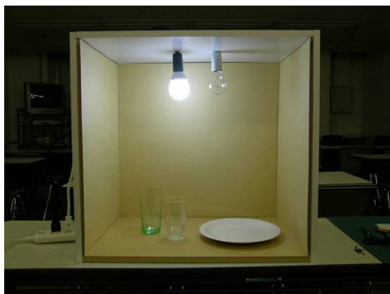
写真2-2 実験用室内模型ボックス

企画にあたっては、安全・防犯・感情・情緒などあらゆる面で応用できるすまいの設備「照明」を取り上げることにした。照明は子どもたちの住生活においても身近なものであり、学んだ知識を実生活で活用することも期待できる。そこで、授業では近くの店ですぐに購入できる器具を用いた。さらに照明の効果を実際に見てもらうために実験用室内模型ボックス(写真2-2)を製作した。また、1クラス1時限(短縮授業のため45分)と授業時間が限られるため学習内容をイメージしやすくスムーズに進行できるように、事前に自分のすまいにある照明器具を調べてくる宿題をお願いした。当日は建築士4名、行政より3名を派遣した。