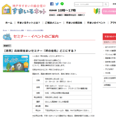
すまいるネットホームページ セミナーの案内