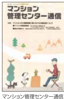
マンション管理センター通信